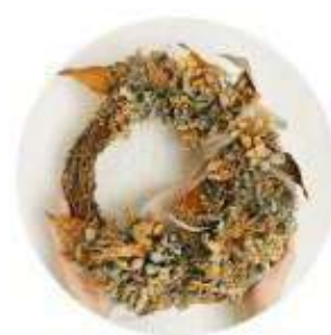
SM2 京都ポルタ たかの【155cm】