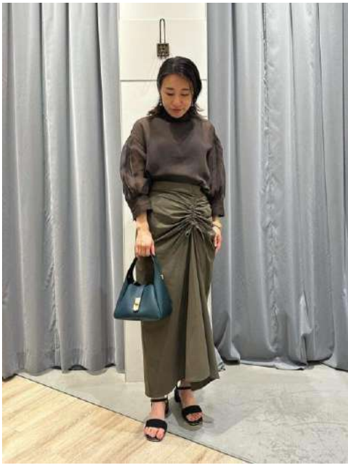
eriさん Te chichi TERRASSE ららぽーと磐田