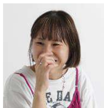
タウン/制作担当 大輪

シンプルながらもアクセサリやバッグなどの小物に統一感があり、おしゃれ上級者の着こなしが目に留まりました👏