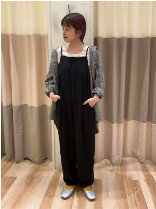
megさん SM2 keittioベニバナウォーク桶川