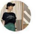
SM2 keittio 湘南モールフィル ユウコ【156cm】

ジレワンピースの裾からチュールスカートを覗かせました👏 ジレワンピースは羽織としてもワンピースとしてもお召しいただけます👏