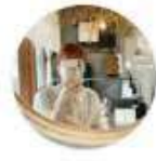
SM2 keittio イオンモール伊丹昆陽 ほうじょう【155cm】

モノトーンなガーリーコーデ👏。 ニットの丈は膝あたりなので スカートやワンピースとの重ね着にも👏 70%が綿素材なのでチクチク感なく、 タンクトップと合わせても違和感なく着用できました!