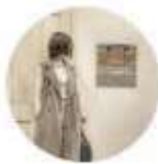
SM2 olohuone エスパル福島 And【169cm】