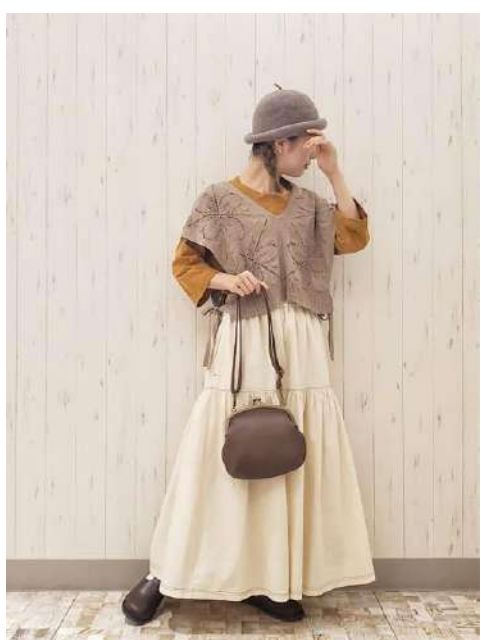
・rioさん SM2 アトレ川崎