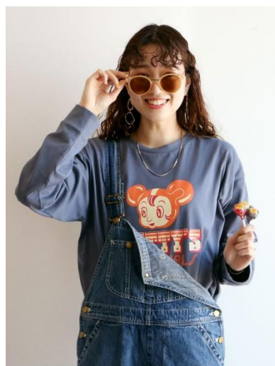
ポップロゴプリントロンT