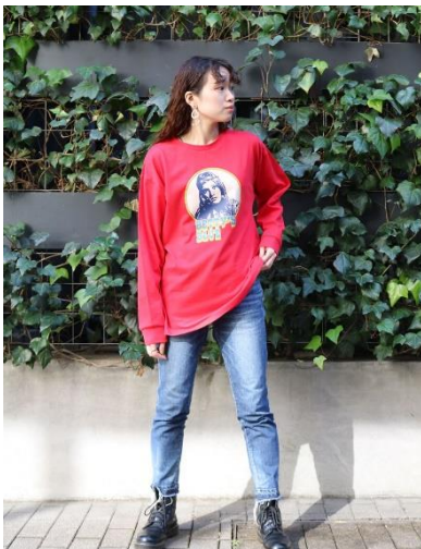
女性モチーフプリントロンT