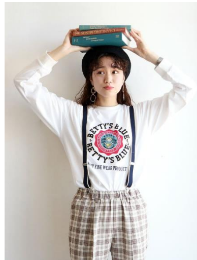
カレッジモチーフロゴロンT