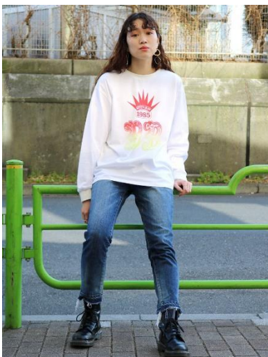
王冠プリントロンT

BETTY'S BLUE のオリジナルカレッジロゴをプリント。トラッドスタイルやカジュアルスタイルなど幅広く着回しできます。